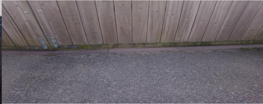
Søndre port slutter ikke tæt ved jorden (se utæthed, hvor bundbelægning mødes)