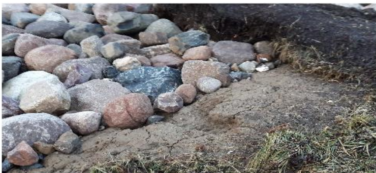
Lille grube ind i diget

Dige D1 efter stormflod 2. jan 2019 Billeder fra 4. jan. 2019