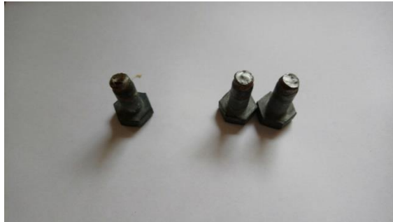
Skruen til venstre var knækket af sig selv – de to til højre knækkede under forsøget på at stramme dem.