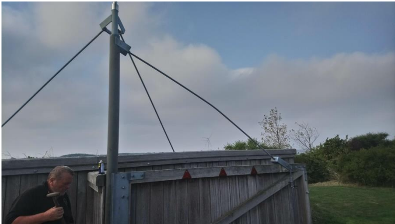
Bøjet stag – søndre port