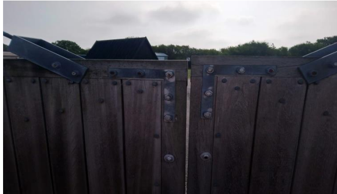
Portene er skæve og slutter ikke tæt